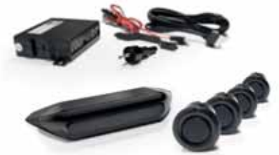
VM01541 Rückfahr-Einparkhilfe mit 4 Sensoren à 18 mm, LED-Balkenanzeige