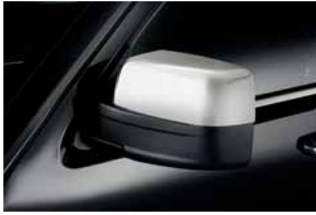
VM01708 Spiegelcoversatz Edelstahl poliert, Abdeckung obere Hälfte des Spiegelgehäuses, Satz