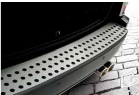
VM01568 Stoßstangenabdeckung Alu, silber-eloxiert, hinten, nur für SXT