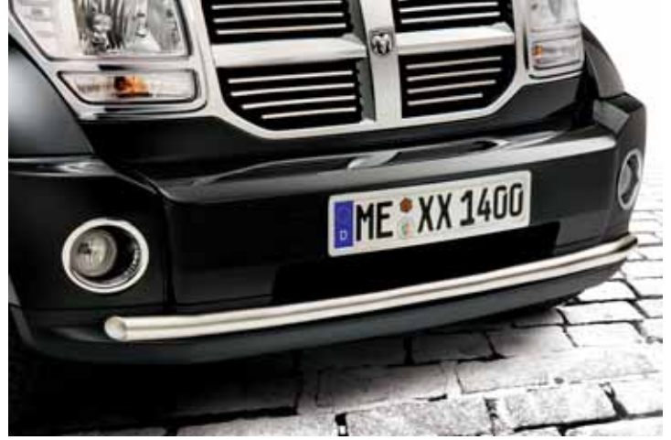
CR01646 EU-Personenschutzbügel 60 mm, Edelstahl poliert, mit EG-Typengenehmigung, mit integriertem Querrohr, ohne Abb.