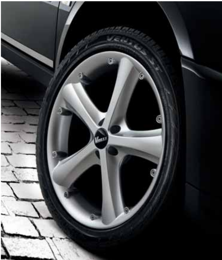
LM01653 Leichtmetallfelge Design Vesuv 9 x 20", ET 35 mm, LK 5/114,3 mm, Mittenloch 71,6 mm, nicht in Verbindung mit Spurverbreiterung