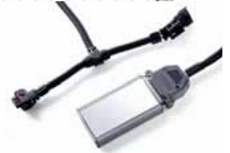
VMDN28 Zusatzsteuergerät zur Leistungssteigerung Leistungssteigerung: + 25 kW, + 65 Nm, Symbolbild