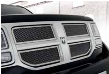
VM01571 Frontgrill Edelstahl verchromt, 4-teilig