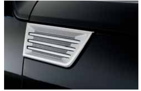
VM01551 Chromblenden-Set für seitliche Lufteinlässe