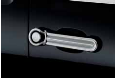
VM01550 Türgriffblenden verchromt, Satz, 8-teilig