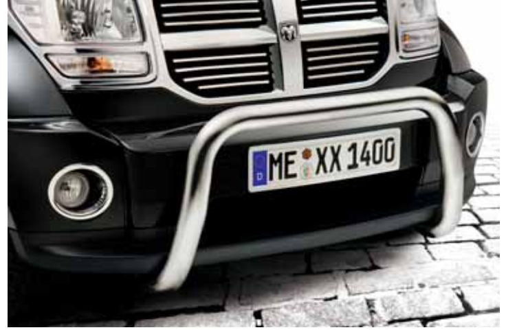
AN01682 EU-Personenschutzbügel 70 mm, Edelstahl poliert, hohe Ausführung