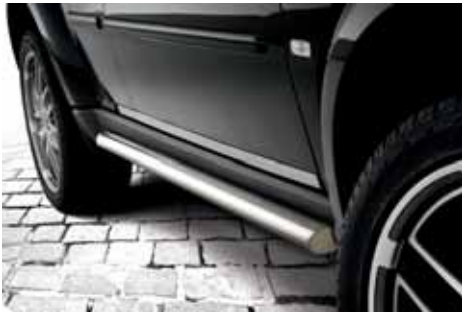
AN01686 Flankenschutzrohr 60 mm, Edelstahl poliert, Satz