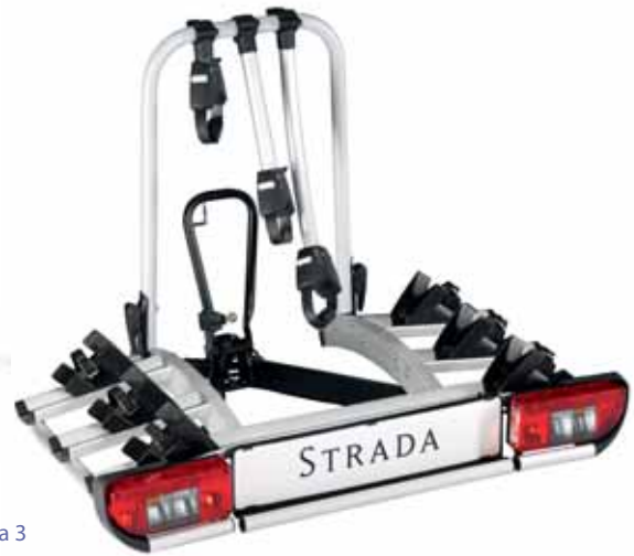
A022601 Heckfahrradträger Strada 3 für 3 Fahrräder, Montage auf Anhängerkupplung