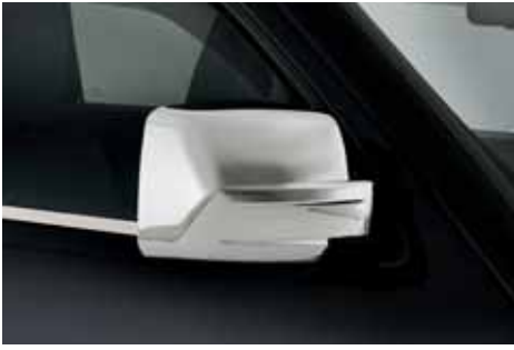
VM01499 Spiegelcoversatz verchromt, Satz