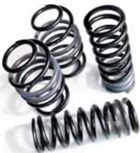
EB01539 Fahrwerk-Tieferlegung 30 mm, 1 Satz bestehend aus 4 Federn, für Diesel und Benziner