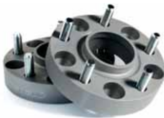
EB00932 Spurverbreiterung Alu, 50 mm achsweise, vorn oder hinten, nicht in Verbindung mit Stahlfelgen