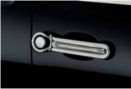
VM01703 Türgriffblenden mit Mittelsteg, verchromt, Satz, 8-teilig