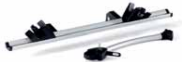
A022610 Anbausatz für ein 3. Fahrrad, für Heckfahrradträger Strada 2