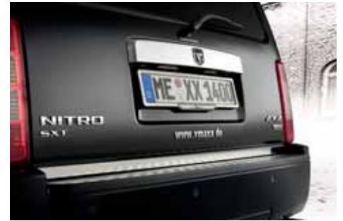
VM01578 Heckklappenzierleiste Edelstahl poliert