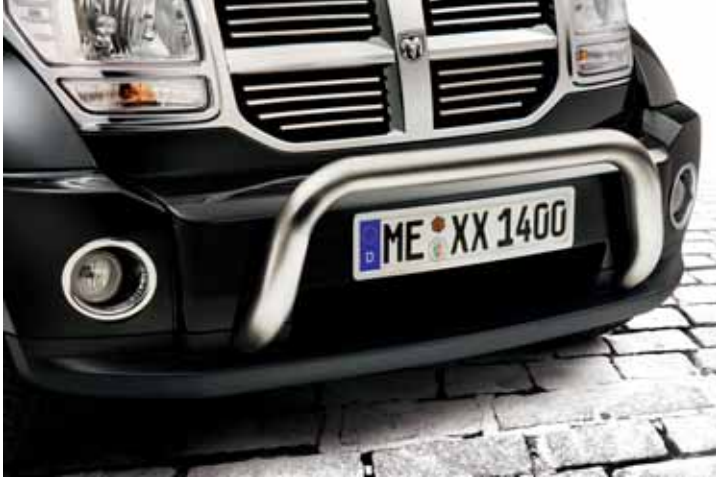
AN01683 EU-Personenschutzbügel 70 mm, Edelstahl poliert, niedrige Ausführung