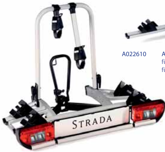
A022600 Heckfahrradträger Strada 2 für 2 Fahrräder, Montage auf Anhängerkupplung