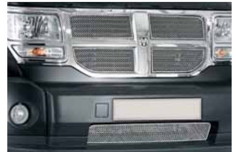
AN01688 Lüftungsgittersatz Edelstahl, für die Lufteinlässe, Kühler- grill und Stoßstange, 5-teilig