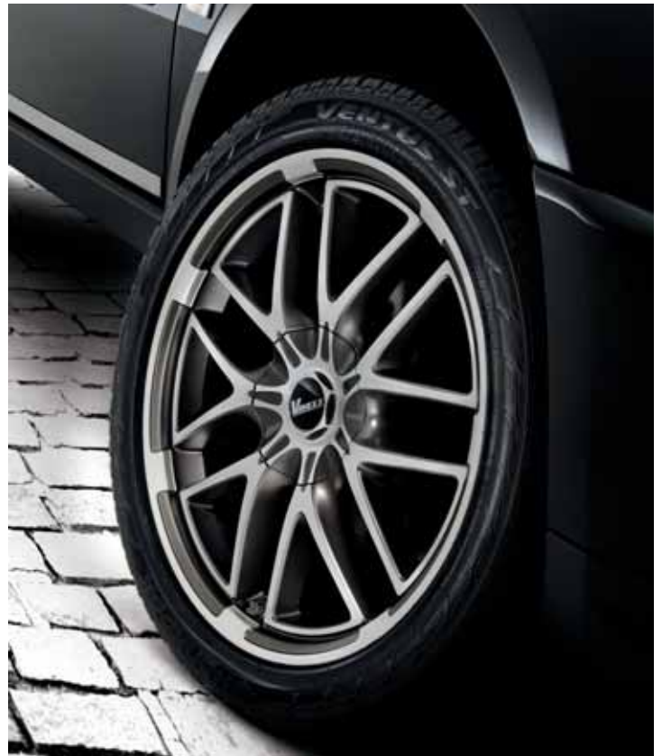
CW01491/AM Leichtmetallfelge Design XA 9 x 20", ET 35 mm, LK 5/114,3 mm, Mittenloch 71,6 mm, anthrazit matt-finish, nicht in Verbindung mit Spurverbreiterung