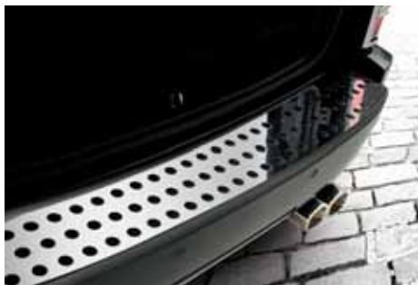
VM01569 Stoßstangenabdeckung Edelstahl poliert, hinten, nur für SXT