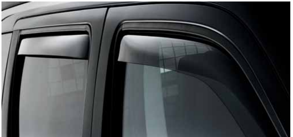
CA01498 Windabweiser hinten, im Set