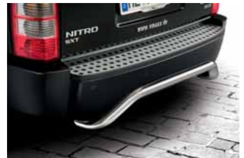
AN01687 Heckbügel 60 mm, Trapezform, Edelstahl poliert