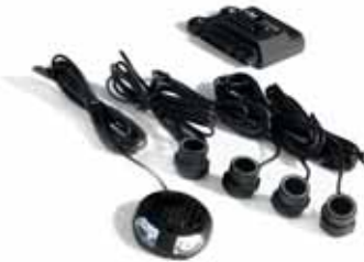
BI00821/1 Rückfahrwarner mit 4 Sensoren, akustischem Signal und LED-Anzeige