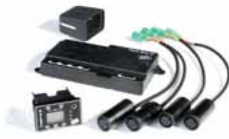
IP00644 Rückfahrwarnsystem Park Boy IV 4 Sensoren und Multifunktionsdisplay