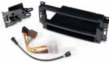
RT01640 Radio-Einbaurahmen für Doppel-DIN-Radios, ohne Kabelsatz