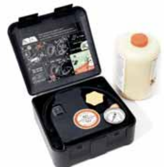
ZY01251 Pannenset Conti inkl. Kompressor