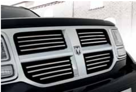
VM01643 Kühlergrillstreben Edelstahl poliert, 16-teilig