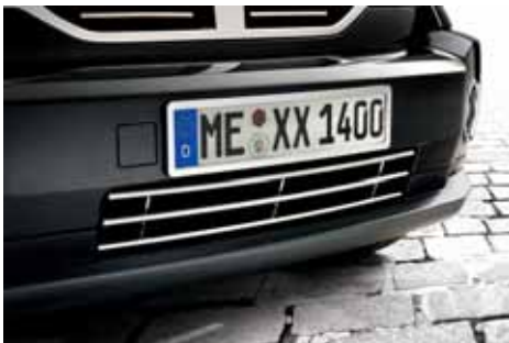
CR01647 Stoßstangengrill Edelstahl poliert