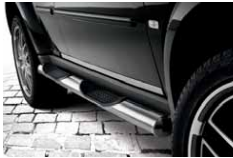
CR01648 Seitenschwellerrohre 80 mm, mit Trittfläche, Edelstahl, Satz