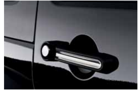
VM01726 Türgriffeinleger und Türknöpfe Edelstahl poliert, 8-teilig, Abb. ähnlich