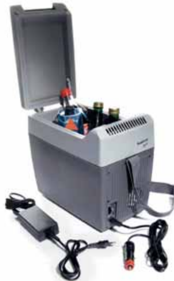
WA01203 Kühlbox 7 l Bruttoinhalt, auch bis zu 65°C beheizbar