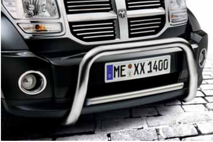
AN01684 EU-Querrohr 51 mm, Edelstahl poliert, nur in Verbindung mit AN01682 oder AN01683