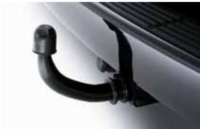
Art. 0836E Anhängerkupplung, abnehmbar