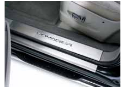
Art. VT00491 Einstiegleistensatz, vorne innen, Edelstahl, mit geprägtem Schriftzug, 2-teilig