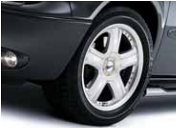
Art. CW00518 LM-Felge Design CX, 8 x 17"