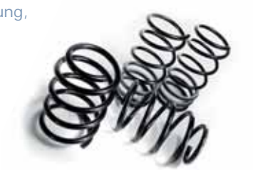
Art. EB00475 Fahrwerk- Tieferlegung, 30 mm, für 2.4 l, nur für Fahrzeuge ohne Niveauregulierung Art. EB00476 Fahrwerk- Tieferlegung, 30 mm, für 2.5 l CRD und 3.3 l, nur für Fahrzeuge ohne Niveauregulierung, nicht für Stow 'n Go