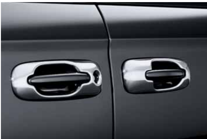
Art. VM00806 Türgriffblenden, verchromt, 4-teilig