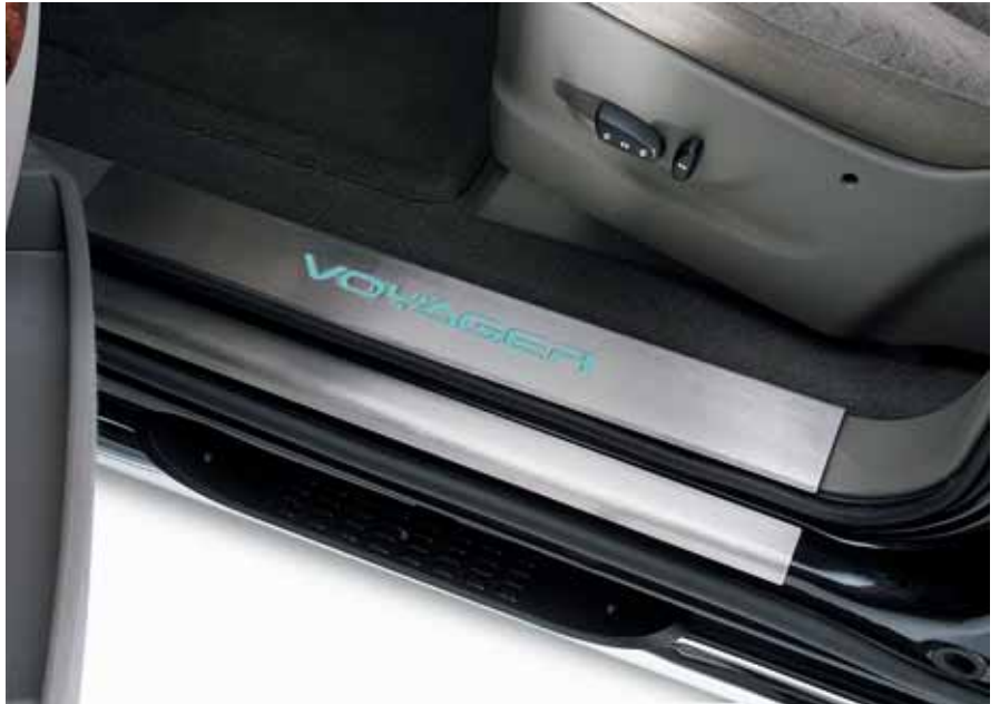
Art. VT00027 Einstiegleistensatz, vorne außen, Edelstahl gebürstet, 2-teilig