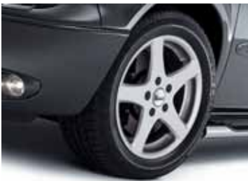
Art. PL00942 LM-Felge Design PA, 7 x 16"