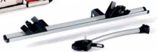
Art. A022610 Anbausatz, für 3. Fahrrad, für Heckfahrradträger Strada 2