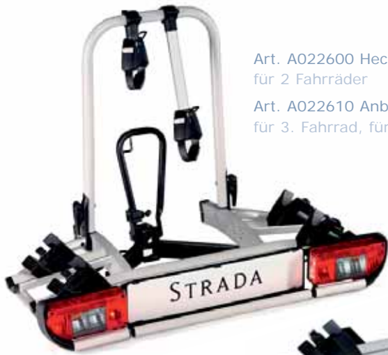
Art. A022600 Heckfahrradträger Strada 2, für 2 Fahrräder