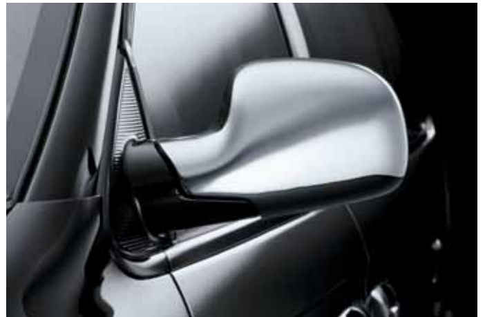
Art. VM00802 Spiegelcoversatz, verchromt, 2-teilig