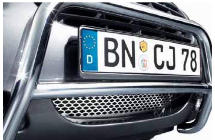
Art. VM01128 Grilleinsatz Design Lochmuster, Edelstahl, Stoßstange unten, ab MJ 2005