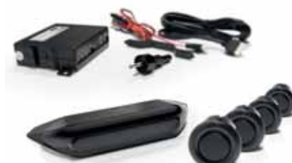
Art. VM01541 Rückfahr-Einparkhilfe, mit 4 Sensoren a 18 mm, LED-Balkenanzeige