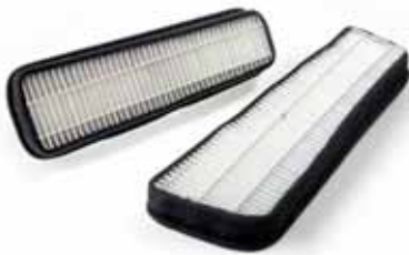
Art. PS00587 Pollenfilter, im Set, MJ 2001 bis MJ 2002, LX-Version ab MJ 2003