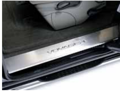
Art. VT00029 Einstiegleistensatz, hinten, Edelstahl, mit geprägtem Schriftzug, 2-teilig