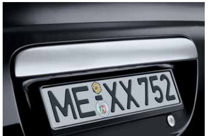
Art. VM00805 Heckklappengriff, verchromt