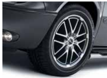
Art. CW01486/AM LM-Felge Design XA, 8,5 x 19", ET 35 mm, LK 5/114,3 mm, Mittenloch 71,5 mm, anthrazit matt-finish