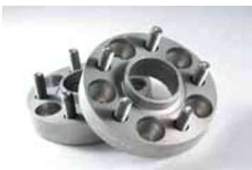
Art. EB00741 Spurverbreiterung, vorne oder hinten, 50 mm achsweise