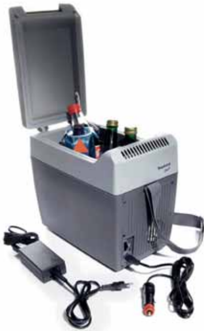
Art. WA01203 Kühlbox, 7 l Bruttoinhalt, auch bis zu 65° C beheizbar