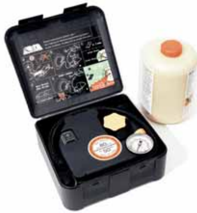
Art. ZY01251 Pannenset Conti inkl. Kompressor