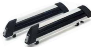
Art. A082704 Skiträger Nova 4, für vier Paar Ski, abschließbar

Weiteres Dachträgerzubehör auf Anfrage, z.B. Dachboxen von 310 l bis 650 l.