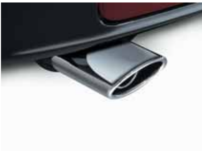
Art. MS01115 Auspuffblende, Edelstahl, verchromt