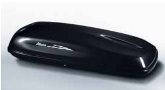
Art. A082166 Dachbox carver 411, Black Magic, 192 x 80 x 40 cm, 420 l, 15 kg

Weiteres Dachträgerzubehör auf Anfrage, z.B. Dachboxen von 310 l bis 650 l.