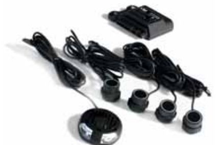
Art. BI01270 Front-Einparksystem, mit 4 Sensoren, akustischer Signal und LED-Anzeige