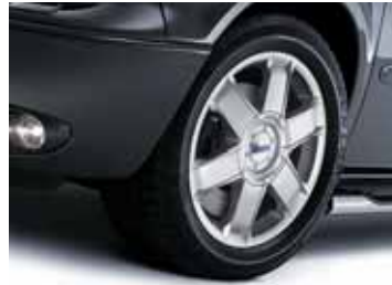
Art. CW00743 LM-Felge Design CWA, 8 x 17"