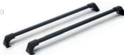
Art. A080105 Dachgrundträger