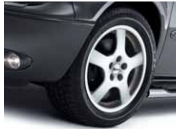
Art. CW00945 LM-Felge Design CB, 7 x 16"