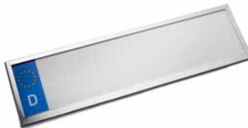
Art. E-DB13 Kennzeichenhalter EU Norm, Edelstahl, 52 cm, gerade, einzeilig