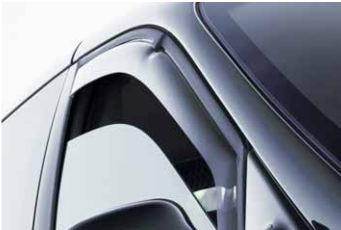
Art. CA00582 Windabweiser, vorne, 2-teilig, Abb. ähnlich