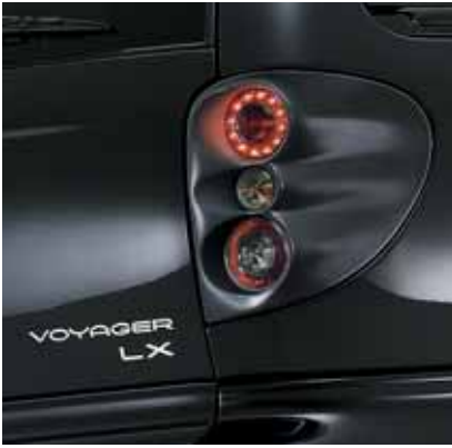
Art. VT00647 Heckleuchtenset Magicmodul mit LED Kreis, Blenden lackierfähig