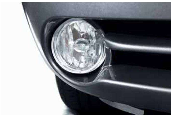
Art. VM01127 Nebelscheinwerfer, Nachrüstset, bestehend aus zwei Klarglasscheinwerfern mit Haltern, ab MJ 2005