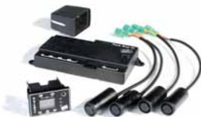
Art. IP00644 Rückfahrwarnsystem Park Boy IV, mit 4 Sensoren und Multifunktionsdisplay