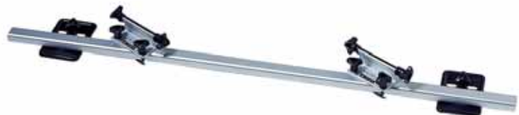
Art. TH00592 Thule Indoor Fahrradhalter, Montage im Fahrzeug