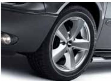
Art. AL01217 LM-Felge Design F, 7 x 16" Art. AL01218 LM-Felge Design F, 8 x 18"