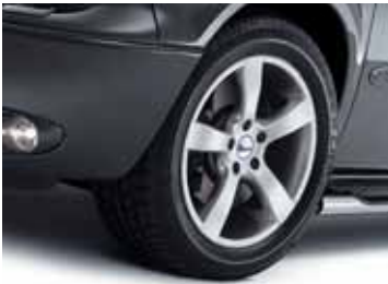
Art. PL01216 LM-Felge Design PY, 7 x 16" Art. PL00943 LM-Felge Design PY, 8 x 17"